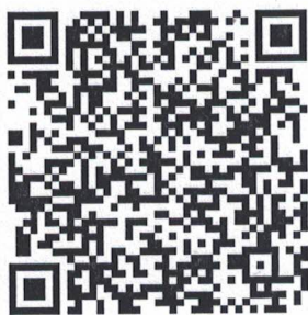
博士研究生复试费

第二步：进入订单支付界面，在交费信息中填写交费金额，在其他信息中填写证件号、姓名、报考专业、研究方向、报考学院、联系电话，核对无误后，点击支付即可。